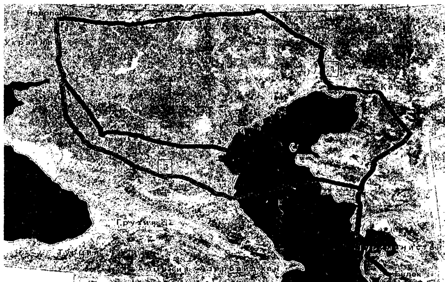
Рис. 1. Варианты прохождения трасс проектируемого газопровода Туркменистан-Украина

В качестве области исследований была выбрана территория, вмещающая три предварительных варианта проектируемой трассы, предлагаемых заказчиком (рис.1):