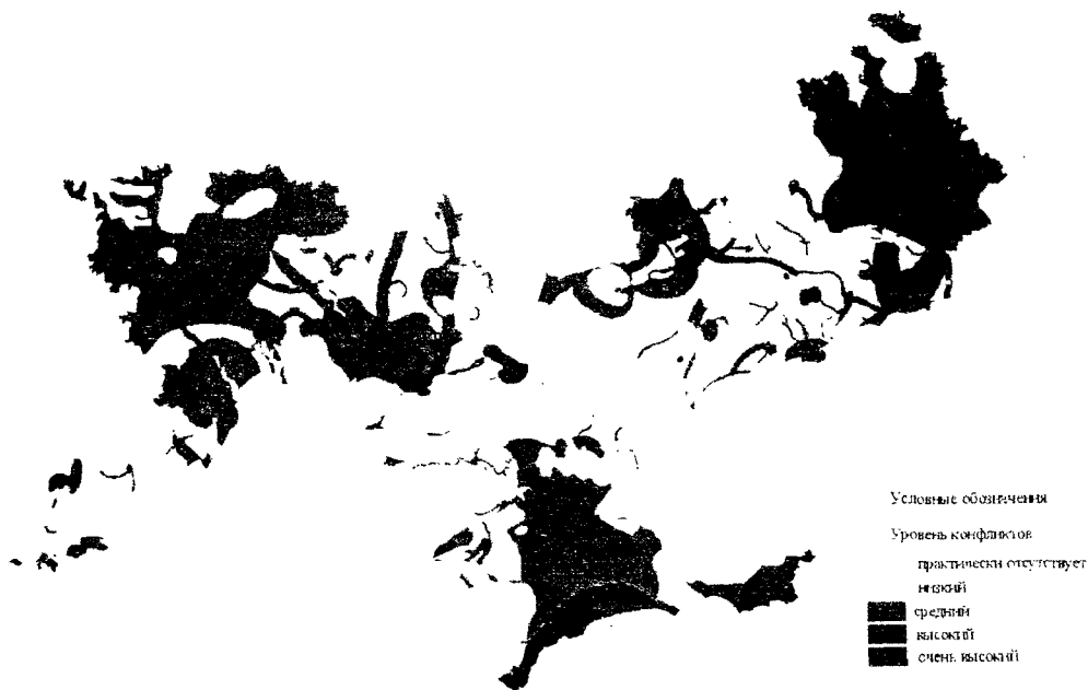
Рис. 3 – Карта конфликтов