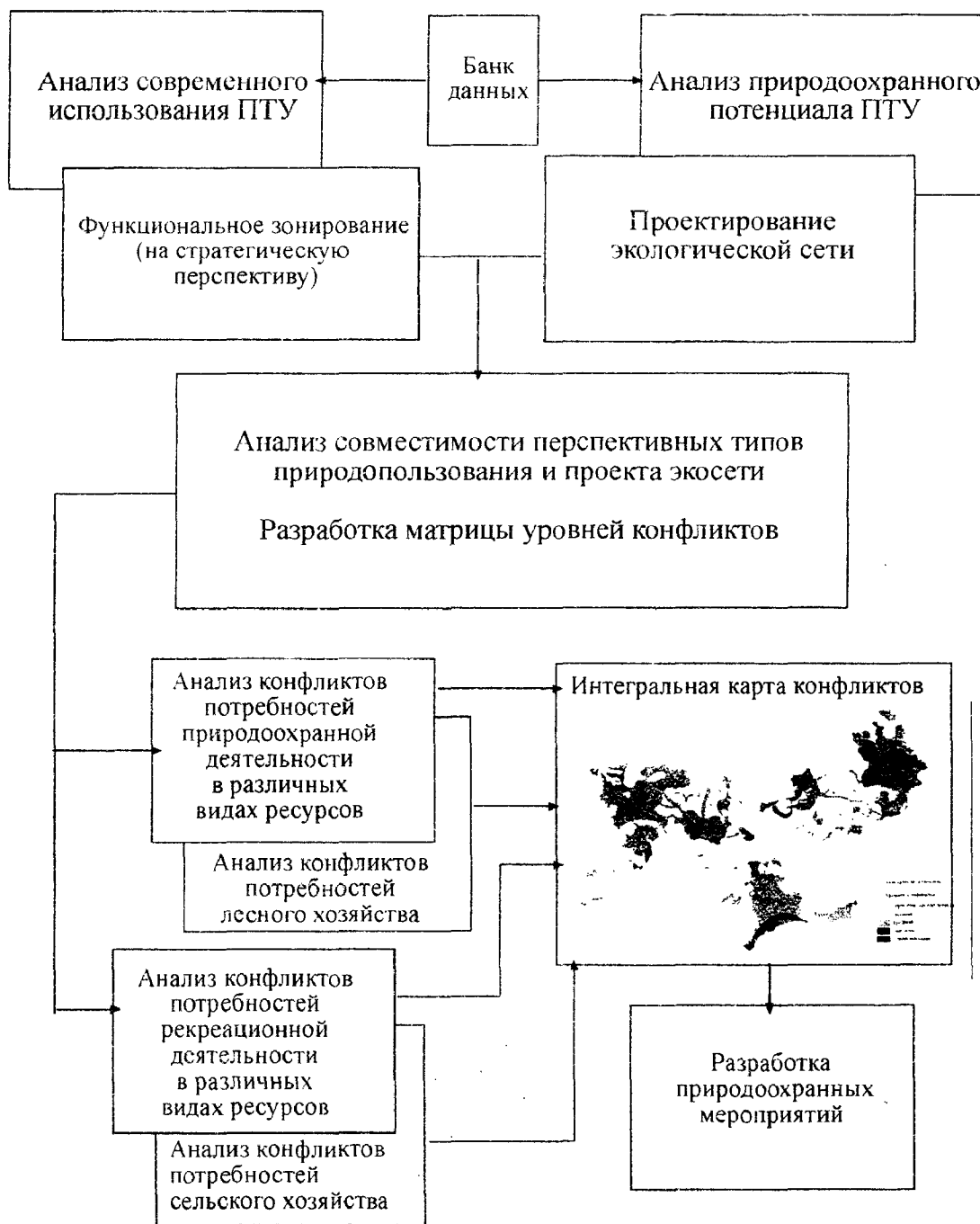
Рис. 1 Алгоритм разработки карты конфликтов природопользования

Вышеперечисленные задачи решались на основе изучения природно-географических и хозяйственных особенностей территории, сложившейся планировочной ситуации, а также на заложенной в "Генеральной схеме