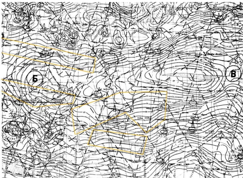
Рис. 1 (продолжение).