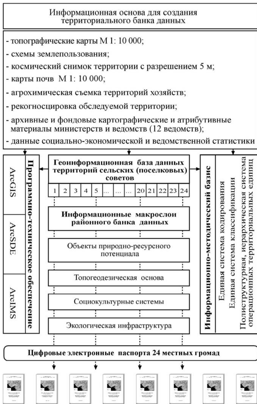
Рис. 2. Структура территориального банка данных Сакского района Автономной Республики Крым