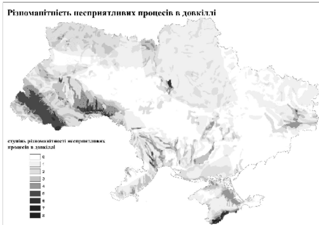
Рис.5. Схема різноманітності несприятливих процесів в довкіллі

Також, нами було проаналізовано поширення на території України умов, сприятливих для розвитку альтернативних видів енергетики, як одного з пріоритетних на сьогодні напрямків розвитку дружніх до довкілля технологій. Зокрема, Карпатський регіон є перспективним для розвитку малої гідроенергетики, а південь України, насамперед, смуга вздовж узбережжя Чорного та Азовського морів, характеризується особливо сприятливими умовами для розвитку сонячного та вітрового видів енергетики.