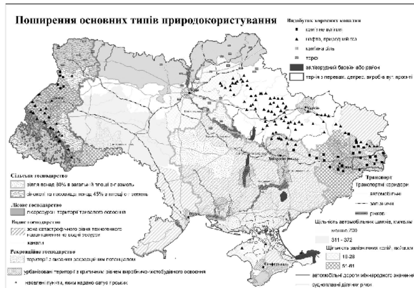
Рис. 1. Узагальнююча схема поширення основних типів природокористування

Використовуючи модуль розширення ArcGIS – Spatial Analyst нами був проведений оверлейний аналіз поширення різних типів природокористування, результатом якого стала побудова схема різноманітності типів природокористування .