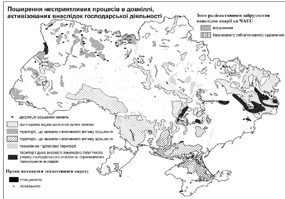
Рис.4. Узагальнююча схема поширення несприятливих процесів в довкіллі, активізованих внаслідок господарської діяльності

За тією ж самою методикою, що була використана для проведення оверлейного просторового аналізу типів природокористування, нами були проаналізовані схеми “Несприятливі природні процеси” та “Несприятливі процеси в довкіллі, активізовані внаслідок господарської діяльності”, що дозволило нам побудувати схему різноманітності несприятливих процесів в довкіллі (рис. 5).