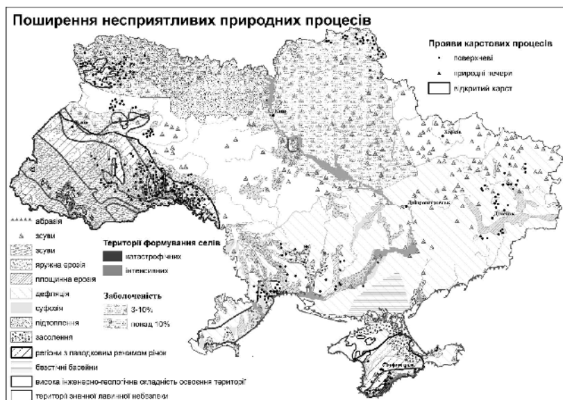
Рис.3. Узагальнююча схема поширення несприятливих природних процесів

Прояви більшості з природних небезпечних процесів підсилюються антропогенною діяльністю. Територіальне поширення несприятливих процесів в доквітлі, активізованих внаслідок господарської діяльності, також нами було проаналізовано та узагальнено (рис. 4).