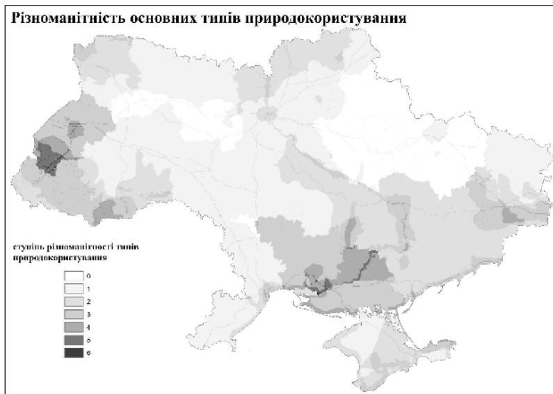
Рис.2. Схема різноманітності типів природокористування